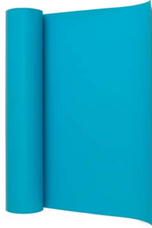
Blauwe ExtruPol afichtingsbaan

Het is natuurlijk van het grootste belang dat zowel ExtruBit als ExtruPol geen giftige stoffen bevatten die schadelijk zijn voor de gezondheid van mensen, vissen en waterplanten.